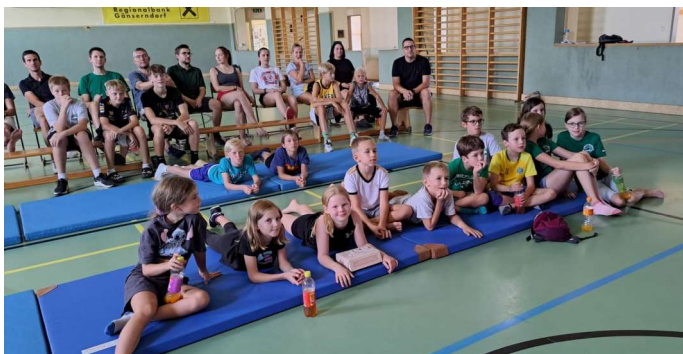
Begeisterte Gesichter in der Unionhalle