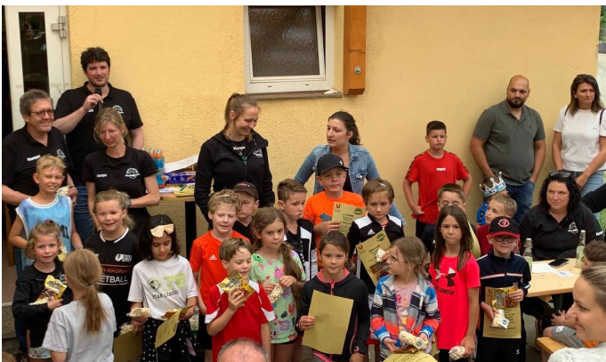
Gruppenfoto Mikros & Piccolinos

Bei Grillerei und Getränken klang die Saison gemütlich aus. In der Halle wurde wieder „ewig“ weitergespielt, bevor es in eine verdiente Sommerpause geht. Ein großer Dank ging auch an Ulli & das tatkräftige Buffetteam .