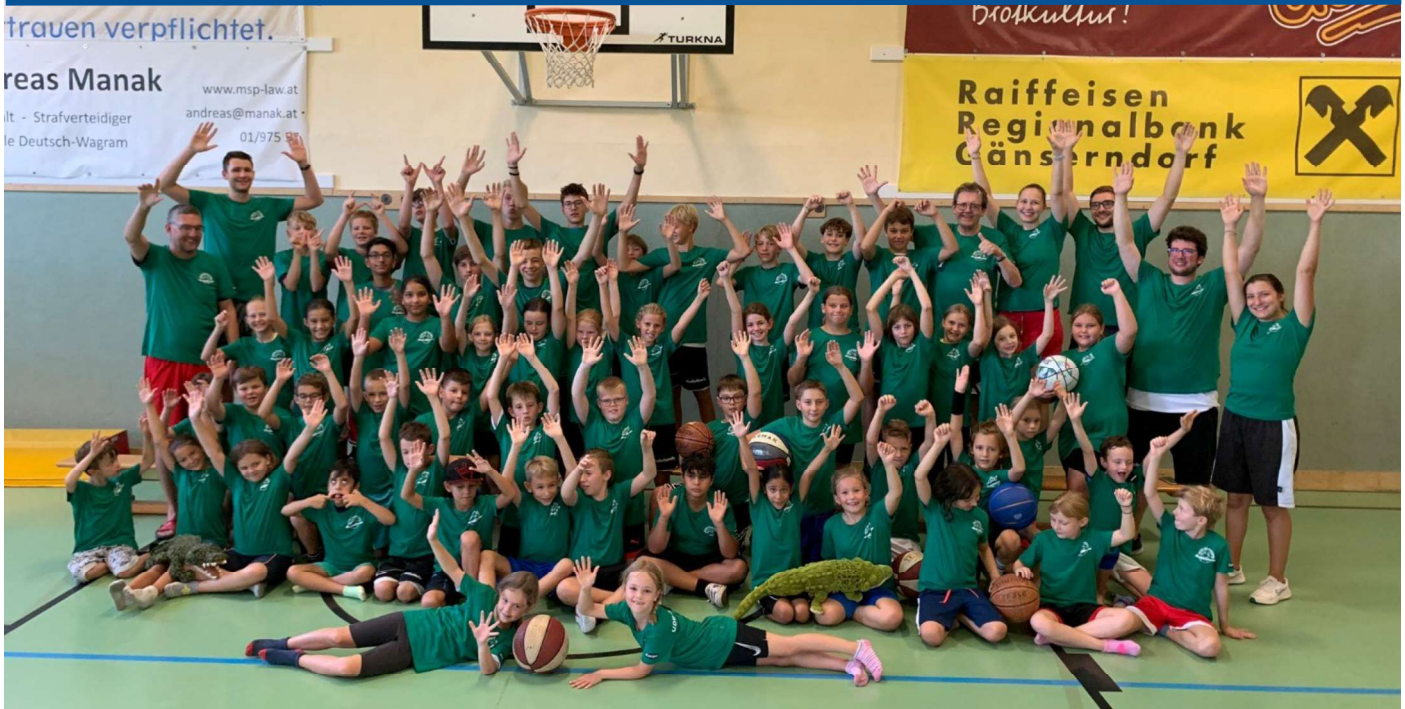
Gruppenfoto vom erfolgreichen Basketball-Summer Camp der UDW Alligators im August 2023 - Fortsetzung auf Seite 2.