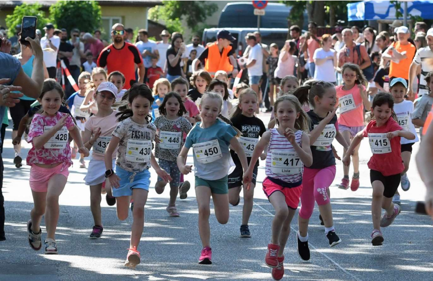
Laufbegeisterung steht allen U8-Mädchen ins Gesicht geschrieben