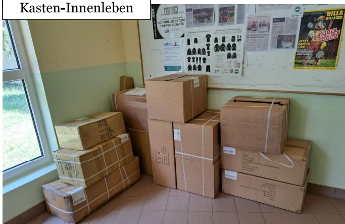
Kistenlieferung am 20.07.2023