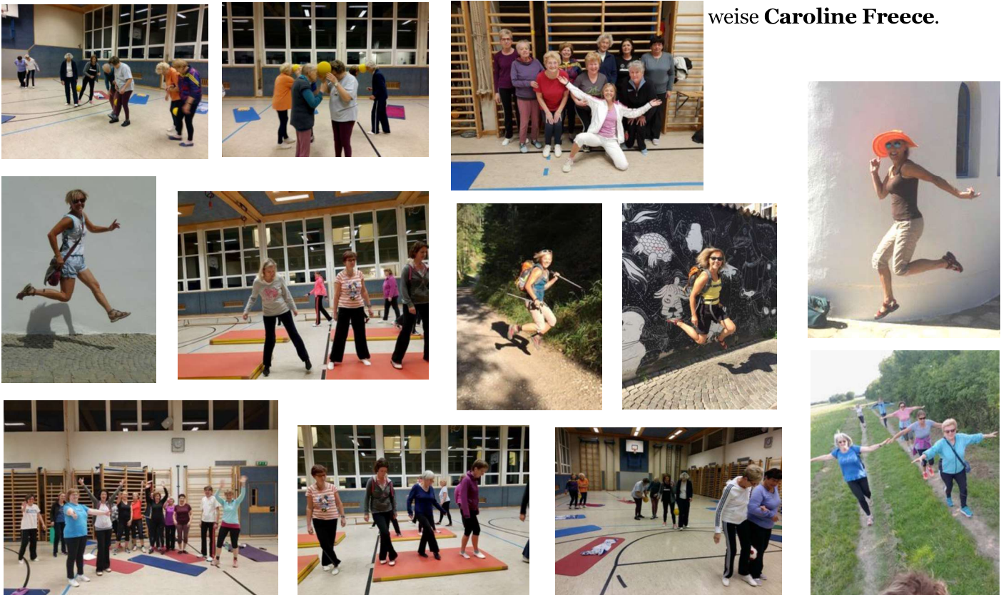
Foto-Collage aus vielen gemeinsamen Momenten „Damengymnastik“ - Spaß & Bewegungsfreude sind darauf auf jeden Fall sichtbar