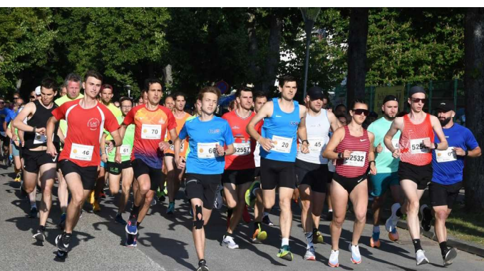
Ein Lauffoto-Klassiker: der Startschuss zum Hauptlauf