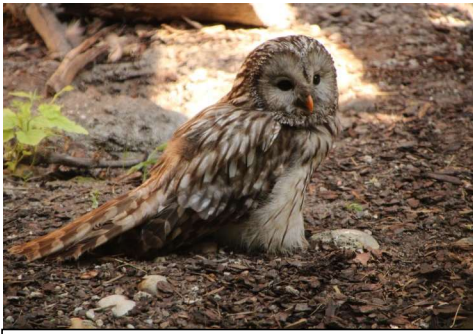
Auch Eulen werden betreut

Am Sonntag, dem 26.06.2023 machten ca. 25 Personen der UDW einen Ausflug zur Eulen- und Greifvogelstation nach Haringsee . Als