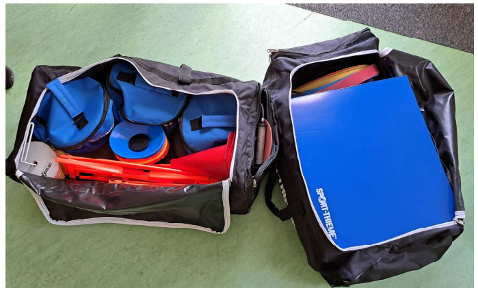
Neue Trainingsutensilien für alle UDW-Sektionen