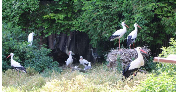
Eine Storchenfamilie in Haringsee

In der über 2 Stunden dauernden Führung erfuhren wir viele interessante Details über sämtliche Tiere, die in Haringsee betreut werden. Uns wurde dabei nie langweilig, weil Herr Frey immer wieder lustige Anekdoten im Zusammenhang mit den Tieren einstreute.