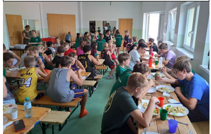
Mittagspause in der Unionhalle