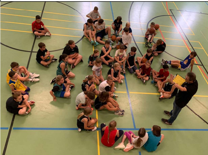
Teameinteilung Saisonabschluss © Anne Strahberger