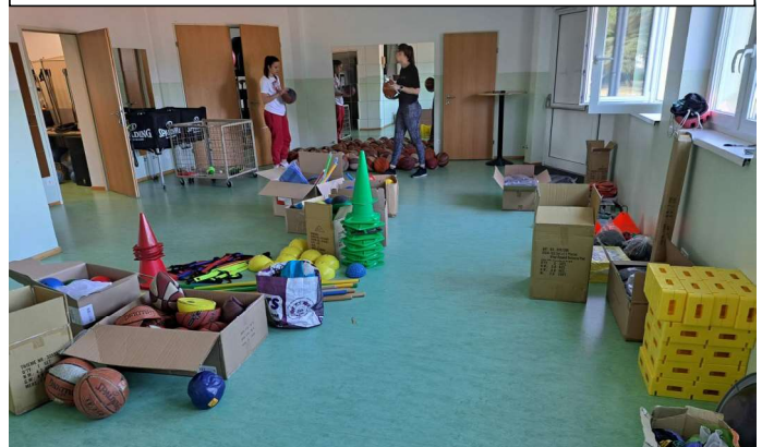
Ausmisten, Ausräumen, Aufpumpen, Beschriften, ...