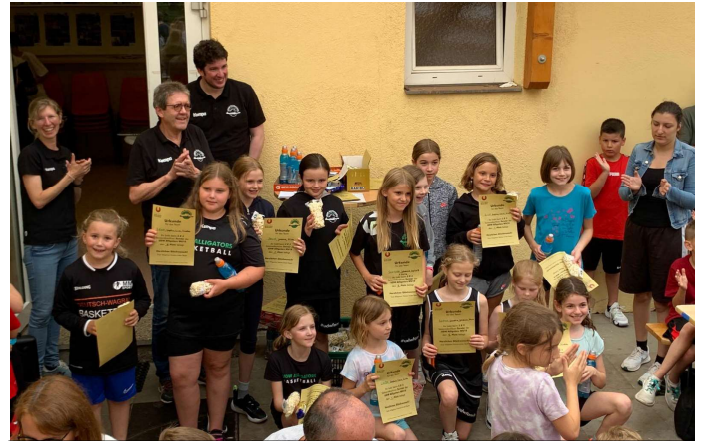
U10/12-Alligatorinnen © Anne Strahberger