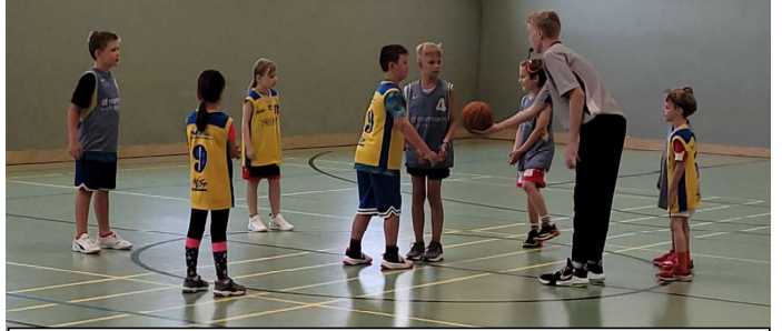
oben: U8 Alligators © Iris Kasteliz - unten: Harpo