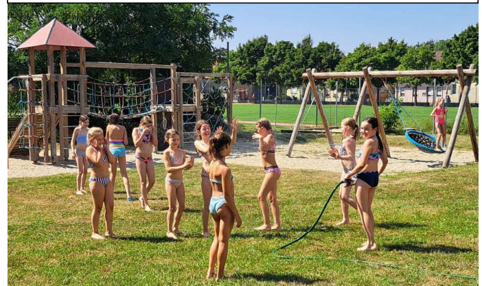
Wasserspiele im Uniongarten